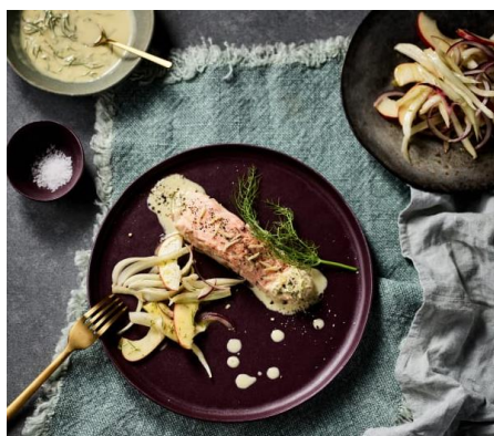
Mode cuisson lente

La cuisson sous-vide garantit une cuisson homogène des aliments, les saveurs et les qualités nutritionnelles sont préservées. C'est une méthode idéale pour préparer les aliments les plus délicats nécessitant une cuisson à température contrôlée sans risque de sur-cuisson.